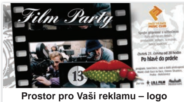
Prostor pro Vaši reklamu – logo