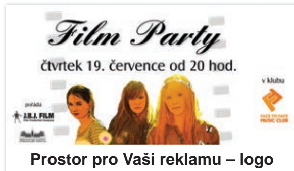
Prostor pro Vaši reklamu – logo