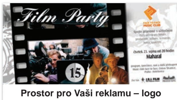
Prostor pro Vaši reklamu – logo